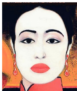
Il volto del manifesto di Mattotti

La dodicesima edizione del Ca' Foscari Short Film Festival si svolgerà in presenza a Venezia dal 4 al 7 maggio 2022 in versione «diffusa». Oltre alla storica sede dell'Auditorium Santa Margherita, il festival collaborerà con altre istituzioni veneziane, portando le opere in programma in sei luoghi differenti. Lo Short, il cui manifesto è stato firmato per la terza volta da Lorenzo Mattotti, è il primo festival in Europa interamente concepito, organizza-